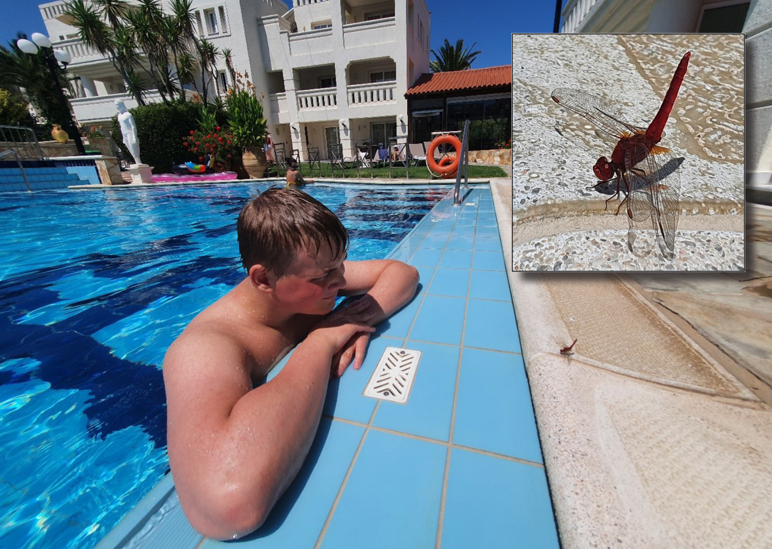
Ovan: Vår son spanar på en karminstrollslända Crocothemis erythraea från poolen. Infällt, en närbild på karminen. Nedan: Agia Lake, nära Chania och turistorterna i västra delen av Kreta.