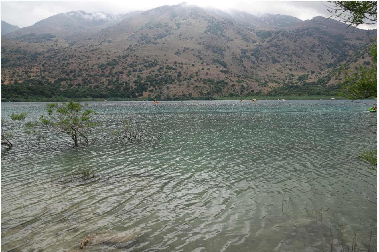
Kournasjön där turister är ute med trampbåtar. I de små buskarna och vasstråna på grunt vatten längs stranden satt det pokalflicksländor Erythromma lindenii .

annulata och tre arter sjötrollsländor (inklusive blåpannad sjötrollslända och större sjötrollslända som var helt blåpudrad), mindre kejsartrollslända och karmintrollslända, bland annat.