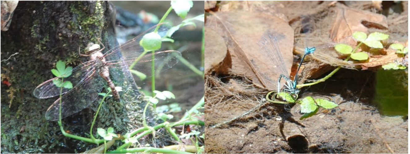
Äggläggande Boyeria cretensis och par i tandem av Coenagrion intermedium . Tyvärr blev bilderna ganska dåliga i det dunkla ljuset på ravinens botten.

tämligen omgående Lindenia tetraphylla (två exemplar), som emellanåt landade på vägen, vilket var fantastiskt kul. Dessutom mindre kejsare och hona av Trithemis annulata .