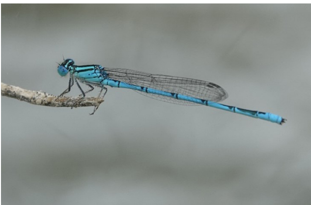
Pokalflicksländor Erythromma lindenii vid Kournasjön, med mörkblå ögon, breda skulderlinjer samt huvudfläckar som bildar en linje.

En dag spenderades för att försöka hitta de två endemiska arterna samt Lindenia tetraphylla . En fantastiskt fin lokal för båda endemerna var Mili Gorge. En vandringsled går i en liten ravin med en bäck på ravinbotten och vi hittade en bra lokal för båda arterna alldeles i början av vandringen, nästan direkt när man kom ner till botten och nära ett väldigt trevligt café (som fraktade allt sitt gods ner med hjälp av linbana).